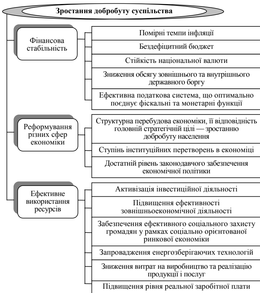
Рис. 6. Декомпозиція генеральної мети соціально-економічного розвитку України

Державне регулювання та управління здійснюється застосуванням економічних та адміністративних важелів. Перелік деяких видів державної політики та інструментів, що застосовуються для досягнення її цілей, наведено у табл. 2.