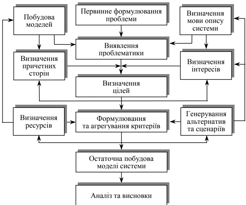
Рис. 7. Головні етапи проведення системних досліджень Проблеми алгоритмізації системних досліджень

Під алгоритмом розуміють скінченний упорядкований набір точних правил, що описують, які дії і в якій послідовності необхідно виконувати, щоб після скінченного числа кроків досягти поставлену мету або одержати розв'язок завдання.