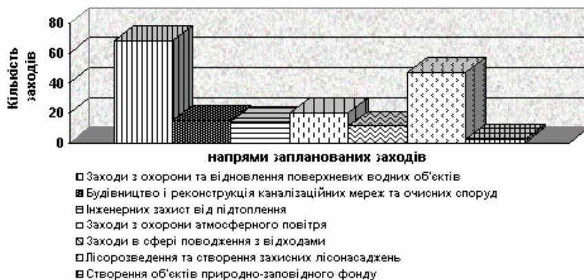
Рис.1. Розподіл запланованих заходів за напрямами природоохоронної діяльності

Достатньо ефективно в області реалізуються заходи щодо лісорозведення та створення захис-