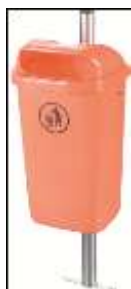
Корзини пластикові 50 л

Корзини мають гладеньке покриття, завдяки чому сміття не прилипає на стінки. На корзинах встановленні замки з універсальним трьохгранним ключем. Матеріал, з якого виготовлені корзини рециклований, не містить кадмію, захищений від хімічних та біологічних впливів, стійкі проти дії УФ променів та низьких температур, до -40^{\circ}\text{C} .